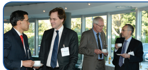
Die Experten tagten im Plenum und in Kleingruppen. Die intensiven Diskussionen wurden auch in den Pausen fortgesetzt.

10 JAHRE KOMPETENZNETZ VORHOFFLIMMERN - VERNETZTE FORSCHUNG FÜR DEN HERZRHYTHMUS