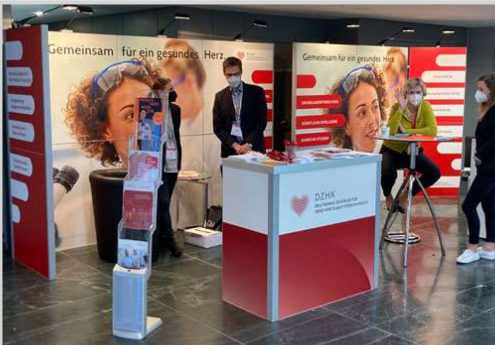
Der neue Messestand des DZHK und der Kompetenznetze bei der DGK Jahrestagung

Mit herzlichen Grüßen Ihr Paulus Kirchhof AFNET Vorstandsvorsitzender